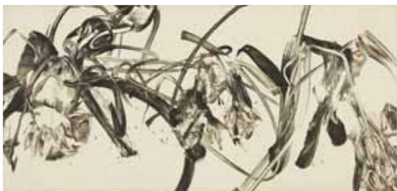
Nathalie Grall (1961- ), La fugue du jardinier 2 , 2015 burin et pointe sèche sur Chine appliqué Collection Musée de Gravelines