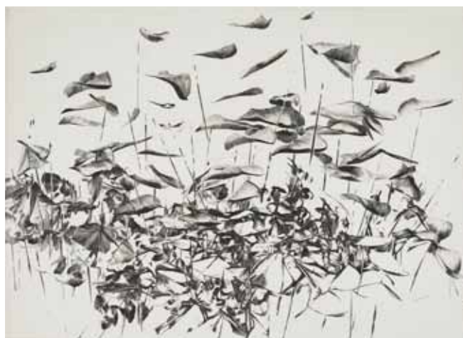
Nathalie Grall (1961-), L'envolée de l'embellie , 2013, burin et diamant Collection Musée de Gravelines

L'étonnant c'est que la deuxième phase de son travail de création, la gravure au burin, n'entame en rien l'éphémère subtilité de ces figures hybrides à la fois animales, humaines, végétales, ou de ces paysages ouverts qui invitent au voyage et à la rêverie. Au contraire, c'est comme si les traits du burin matérialisaient cette évanescence en la sculptant dans le métal, aidant l'artiste à retrouver grâce à la lame qui vibre sous sa main l'impression de départ qui l'a émue.