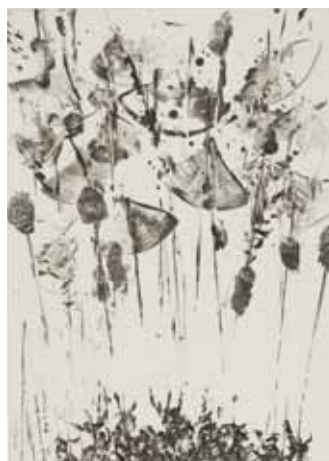
Nathalie Grall (1961- ) Le bataillon des mousses 2013, burin sur Chine appliqué Collection Musée de Gravelines