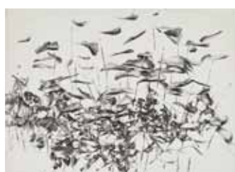
Nathalie Grall (1961- ) L'envolée de l'embellie , 2013 burin et diamant Collection Musée de Gravelines