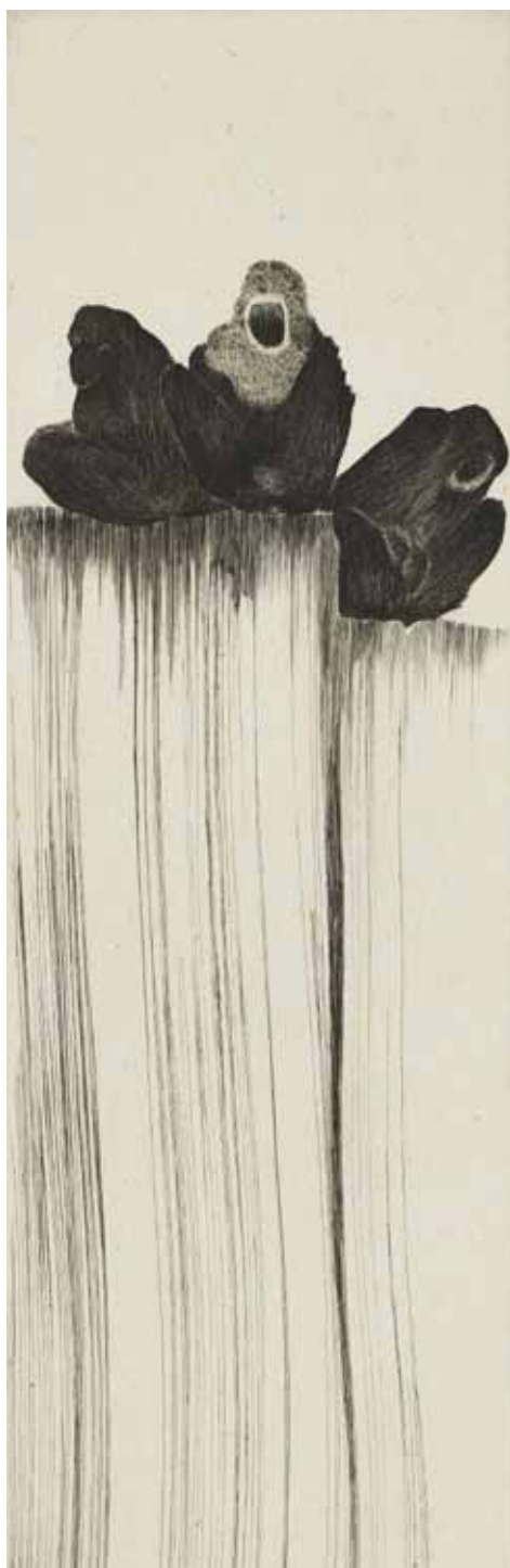
Nathalie Grall (1961-), Trois silences , 2011, burin sur Chine appliqué - Collection Musée de Gravelines

Tout commence avec le pinceau tenu à la verticale sur la plaque de cuivre, tout est affaire de sensation et de geste, celui du peintre-calligraphe dans un premier temps, puis celui du graveur.