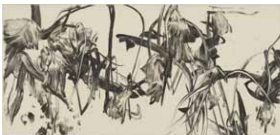
Nathalie Grall (1961- ), La fugue du jardinier 1 , 2015 burin et pointe sèche sur Chine appliqué Collection Musée de Gravelines