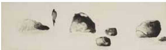
Nathalie Grall (1961- ), Paysage méditatif au bord des larmes , 2003 burin et diamant sur Chine appliqué - Collection Musée de Gravelines