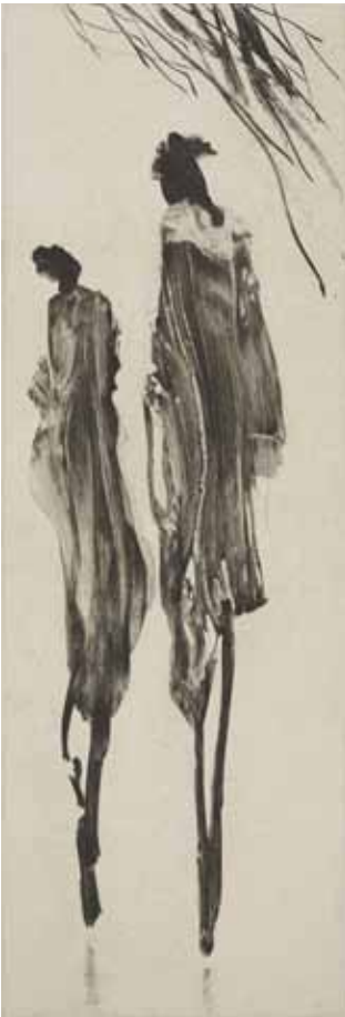
Nathalie Grall (1961- ), L'élégance du doute , 2017 burin et diamant sur Chine appliqué Collection Musée de Gravelines