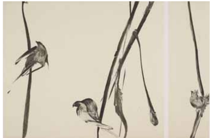
Nathalie Grall (1961- ), Partition , 2007, burin et diamant sur Chine appliqué Collection Musée de Gravelines

Que voit-on au juste ? des signes ou des choses ? des représentations stylisées de la réalité ou des songes ? des images ou des mirages ? un improbable alphabet ou l'exhibition de quelque créature zoomorphe insoupçonnée ? Même lorsque la forme tend à se naturaliser au maximum, on voit, on sent et pressent qu'elle pourrait emprunter in extremis une autre voie.