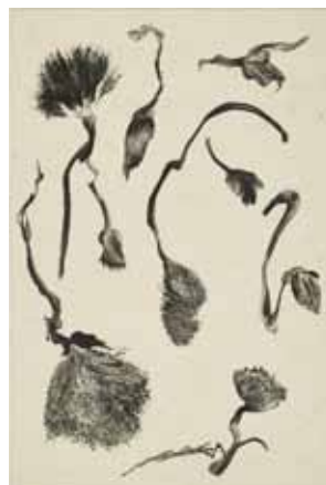
Nathalie Grall (1961- ) La Collection , pl.9, 2017 burin et roulette sur Chine appliqué Collection particulière