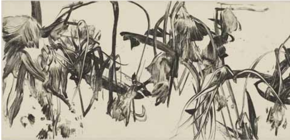
Nathalie Grall (1961- ), La fugue du jardinier 1 , 2015, burin et pointe sèche sur Chine appliqué - Collection Musée de Gravelines